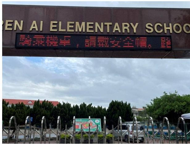
說明：跑馬燈宣導交通安全