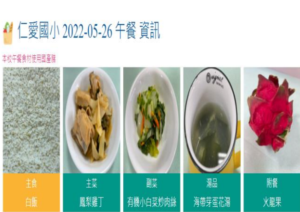
說明：校網公布午餐資訊