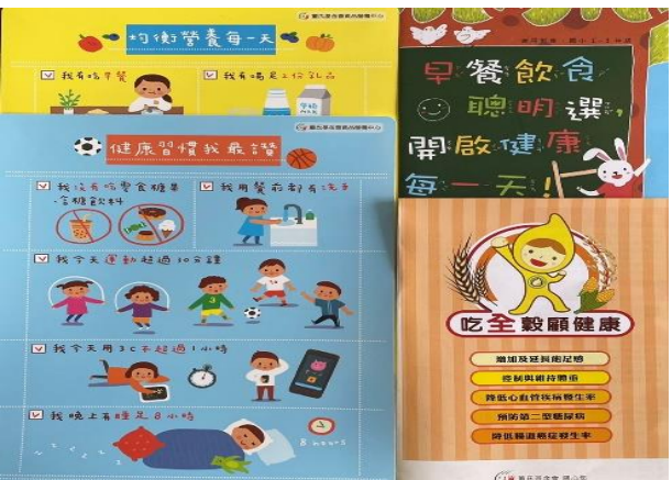
說明：營養教育宣導品