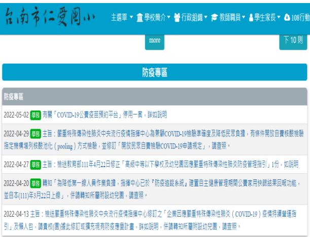
說明：學校網站防疫專區